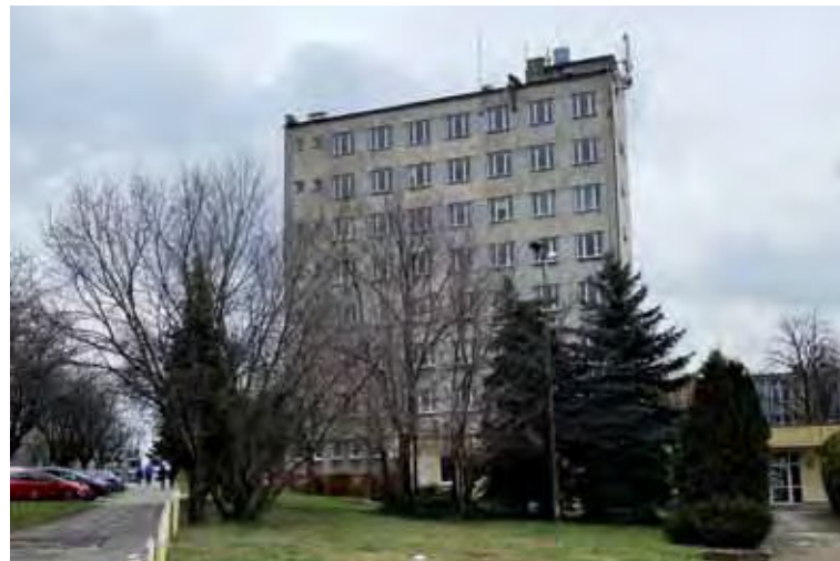
Budynek przy ul. Struga

W ramach tego zadania zostaną ocieplone ściany zewnętrzne biurowca, wymienione okna, drzwi oraz instalacja centralnego ogrzewania. Oprócz tego zostanie zamontowana instalacja fotowoltaiczna, a cały budynek będzie dostosowany do potrzeb osób niepełnosprawnych. Koszt całego projektu to ponad 2 mln 733 tys. zł, z czego dofinansowanie z Unii Europejskiej to suma ponad 1 mln 781 tys. zł. Wszystkie prace budowlane, zgodnie z zapowiedziami ministerstwa, zostaną zrealizowane w latach 2020 – 2021.